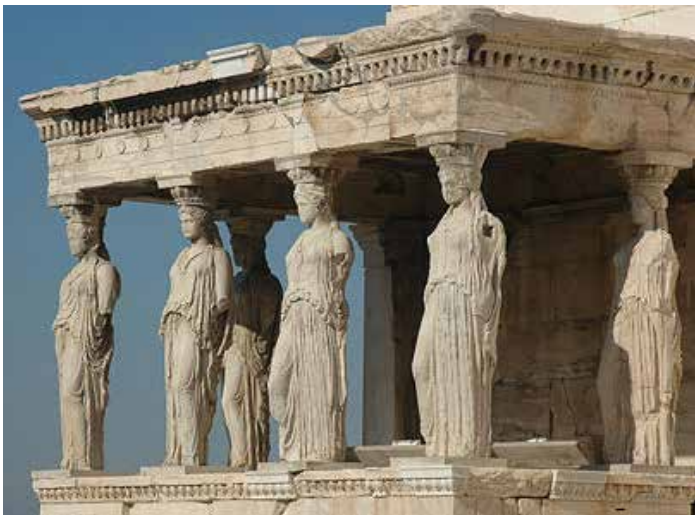
4 . Caryatides > sculptures figées