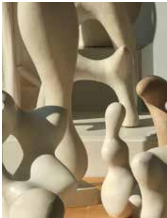
8 . Source inconnue > en volume et en creux > plein et vide