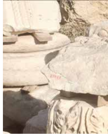
1 . Source inconnue > pierres tombées en ruine

L'équilibre précaire de ces sculptures, les matières changeantes et la question du sol, des appuis résonnent avec la spécialité du circassien, équilibriste et danseur.