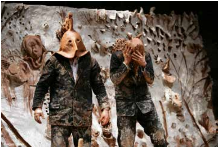
2 . Miquel Barcelo & Joseph Nadj > un danseur et un sculpteur dansant et modelant l'espace tout au long de la pièce