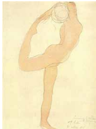
5 . Rodin > le dessin, la sculpture et la danse