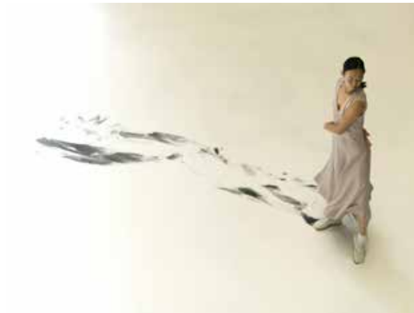
9 . Anne Teresa De Keersmaeker > laisser une trace > lien entre le corps et la matière