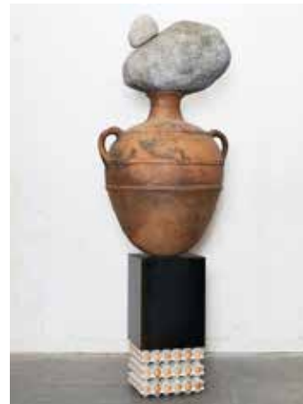
3 . Théo Mercier > recherche d'équilibre précaire > atemporalité, entre antiquité et modernité