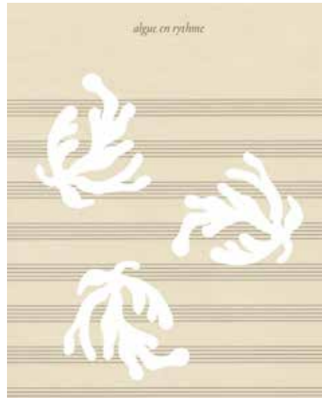
7 . Josphe Schiano Di Lombo > des corps dansant sur de la musique