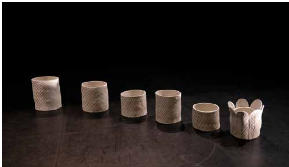
Recherches scénographiques en cours autour d'une colonne en céramique aux formes modulables.